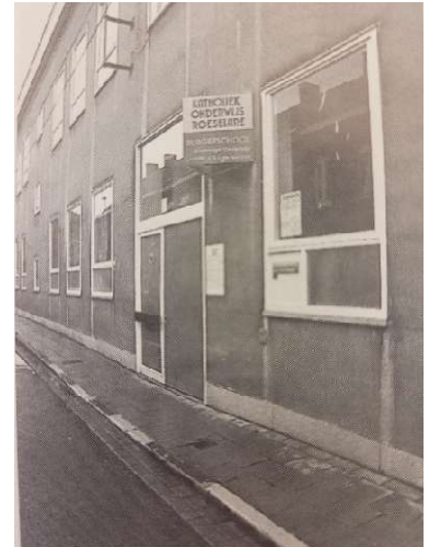
De school in 1996 na de fusie